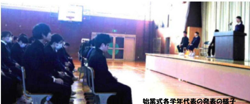
始業式各学年代表の発表の様子

そこで、言い古されている事ですが、人が飛躍をするためには、めあてや目標をどうするかが大事です。昔から「一年の計は元旦にあり」と言われます。発音だとピンとこないかもしれませんが、一年のけいの「けい」は計画の「計」です。自分が「こうだったらいいな」「こうだったらカッコいいな」「素敵だな」と新年にイメージを持ち、それに向けてその一年を努力をする日々になればうまくいくと言われます。