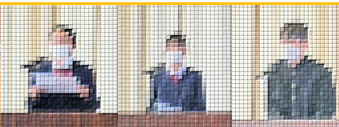
修了証授与 代表 AH 君