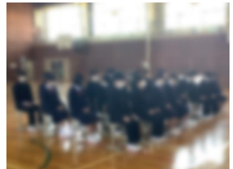
真剣な態度で話を聞いています